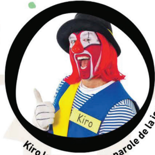
Kiro le Clown, porte-parole de la journée